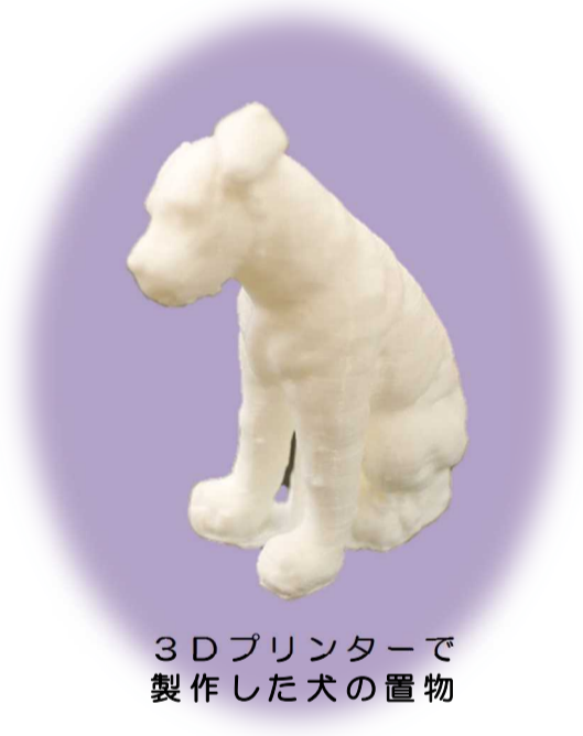
3Dプリンターで 製作した犬の置物

そこで当セミナーでは、3Dプリンターに興味のある皆様へ、3Dプリンターの概要やプリントの流れについて解説し、また実際に出力されている様子をご覧いただきながら、簡単な3Dデータ作成なども行います。